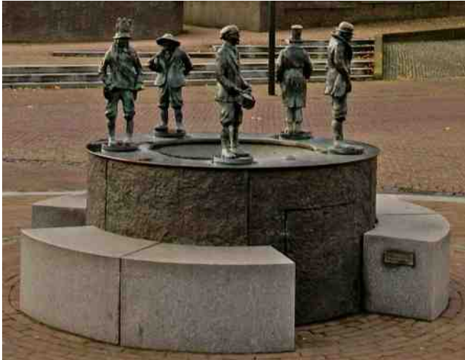
Vijf Gekke Maondaagvierders beelden de kern van Gekke Maondaag uit en de fontein staat symbool voor bruisend Velden

Op het moment dat deze Nieuwsbrief bij de lezers op de mat ploft, zijn de feestdagen van het St.-Sebastianusgilde nog in volle gang. Toch kijkt heel Velden al uit naar de Gekke Maondaag. Het lijken elkaars tegenpolen, toch zijn beiden door de traditie sterk met elkaar verbonden. Karakteristiek voor Velden; eigentijds ingevuld en met respect voor de traditie.