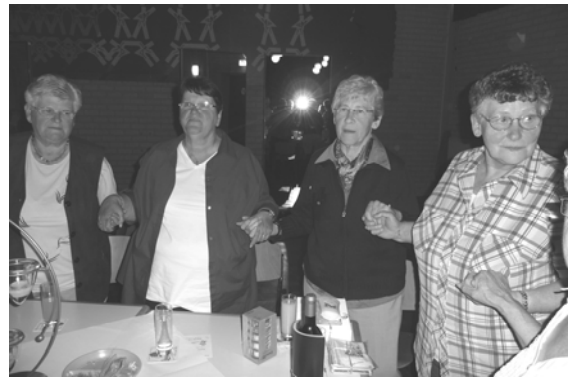
Sfeer goed op het kermismatinee

Liedjes uit de tijd van weleer waren onder andere "Tanze mit mir in den morgen", "Good bye Ireen" en "Melodie d'amour". In de pauze zoals gebruikelijk de tombola met verschillende prijzen geschonken door Veldense ondernemers. Na de pauze (na een paar consumpties) is de sfeer helemaal ontspannen. tijd dus om tussendoor te "Schunkelen" en zelfs de "Polonaise" te doen.