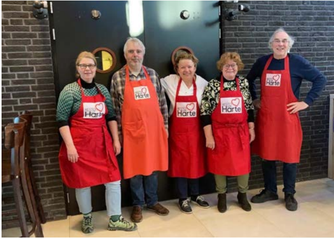
Team Resto VanHarte Velden

Sinds kort kan er elke donderdagavond gezellig gegeten worden in BMV De Vilgaard. Vanaf 18.00 uur wordt er dan een heerlijk driegangenmenu geserveerd. De maaltijdvoorziening is een initiatief van Resto VanHarte, een landelijke vrijwilligersorganisatie, die al 16 jaar bestaat.