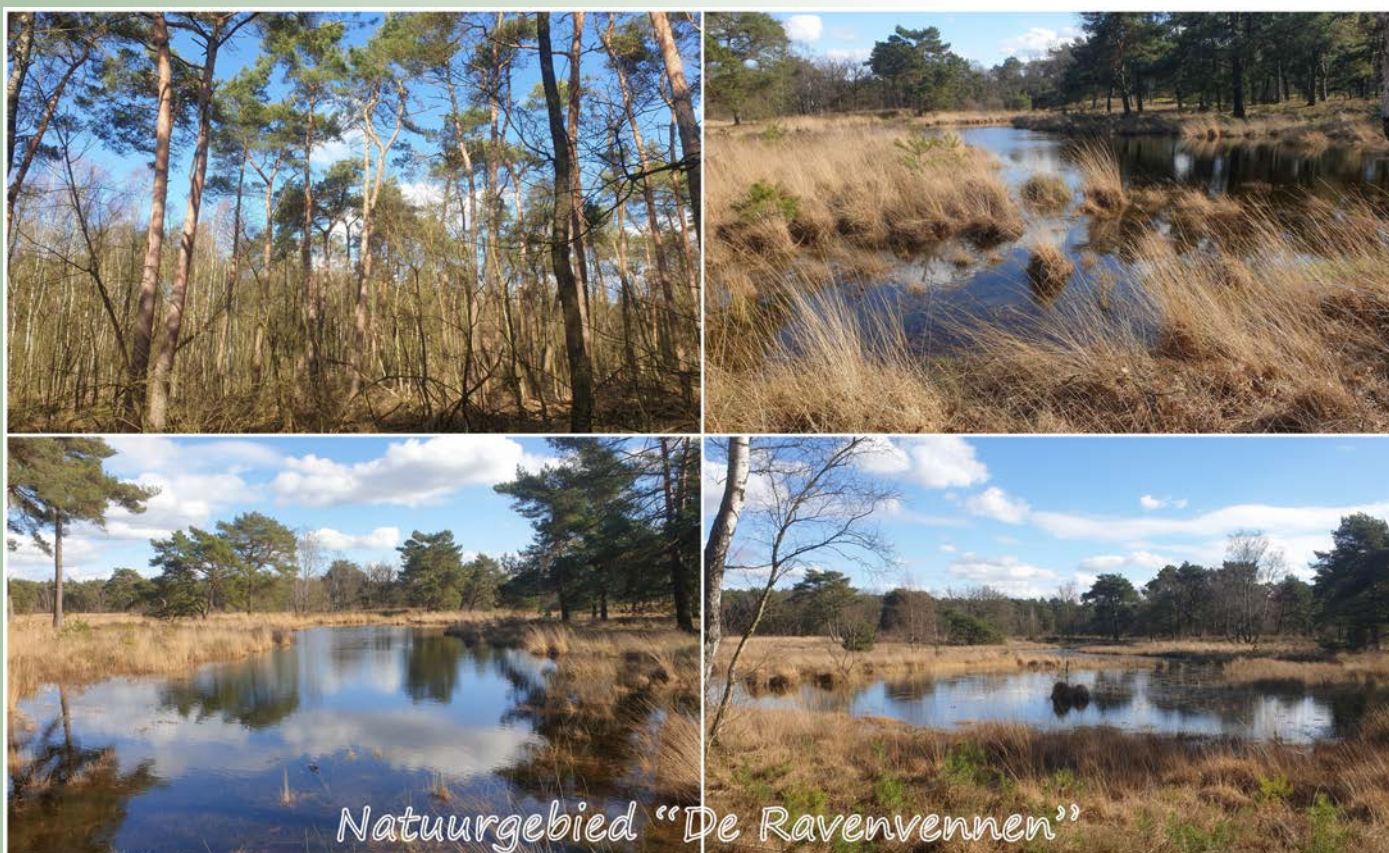
Natuurgebied "De Ravenvennen"